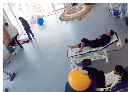
Mutua Navarra: instalaciones de Tudela.