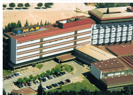
MAZ: Hospital de Zaragoza.