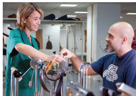
Umivale: instalaciones en Quart de Poblet.