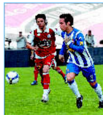
El canterano está tocado

De diez. Antes y ahora. Si el entorno del club apoyase como lo hace siempre la afición... ■